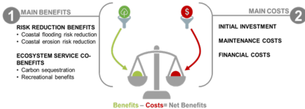
Figura 2. Methodological framework for the socio-economic assessment of adaptation measures to climate change

Orduan, simulazio desberdinak egin daitezke proposatutako irtenbideen eragina aurreratze eta termino ekonomikoetan kostu efizientea den aztertze, hau da, inbertsioa errentagarri ateratzen da epe jakin batean. Kostu/Onura Analisiak ( CBA , ingelesezko siglak) esku-hartzearen zuzeneko kostuak eta horrek ematen dituen onura ekonomikoak alderatuz egiten dira.