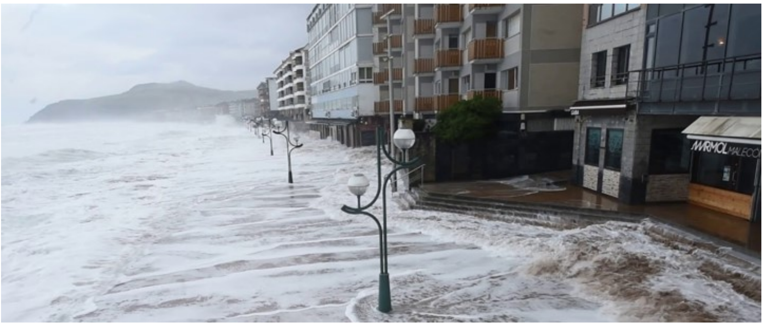
Irudia. Olatuek gogor jotzen dute Zarauzko malekoia. ( link )

Urak har ditzakeen parkeez gain, badira ziklo hidrikoa arautzeko beste joera batzuk ere, hala nola lorategi bidez eta/edo drainatze jasangarriko hiri-sistemen bidez urbanizatutako eremuak iragazkortzea. Azalera horiei esker, euri-urak euri-uren sistema ez gainkargatzea eta ibaiaren emaria ez handitzea lortzen da, NBSen berezko beste funtzio batzuen artean. EAEko esku-hartze horien adibide enblematiko bat Gipuzkoako Legazpi udalerrian egindakoa da ( link ).