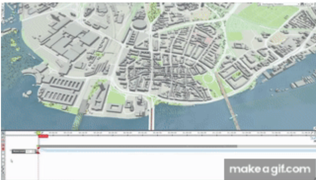
Irudia. Uholdeak kudeatzeko bistaratze-tresna ( link ).

Hala, uholde-ereduei aplikatutako hurbilketak diseina daitezke, eta horien eragina kuantifikatu, urpean gera daitekeen azaleraren murrizketari eta uholde-sakonerari dagokienez. Kalkulu horretan beste emaitza batzuk azaleratzen dira, hala nola uholdeak zuzenean eragingo ez liokeen biztanleria, eta esku-hartzearen aurretik eta ondoren urpean geratu diren establezimenduen kopurua, eta, horrekin batera, saihesten ari diren kalte ekonomikoak.