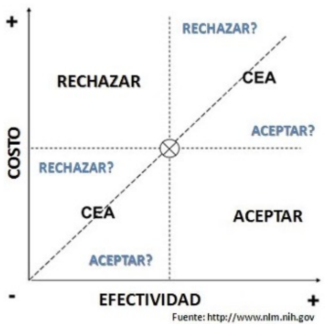
3. irudia – Kostu-onura/eraginkortasun analisia.

Horrekin guztiarekin, helburua diagnostiko bat eskaintzea da, araua bere helburua lortzeko aukerarik onenean oinarritzen den aztertu ahal izateko, bai eta eragin negatiboak minimizatzen lagunduko duten neurri zuzentzaileak edo/eta osagarriak formulatzeko agertoki bat eskaintzea ere.