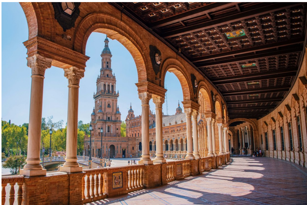
1. irudia. Plaza de España (Sevilla)

Albiste horrek zalaparta sortu du sare sozialetan eta komunikabideetan, eta eztabaidak sortu ditu, batetik, espazio publikoaren pribatizazioarekin lotuta, eta, bestetik, turismoaren gaur egungo kudeaketa kaskarrarekin lotuta.