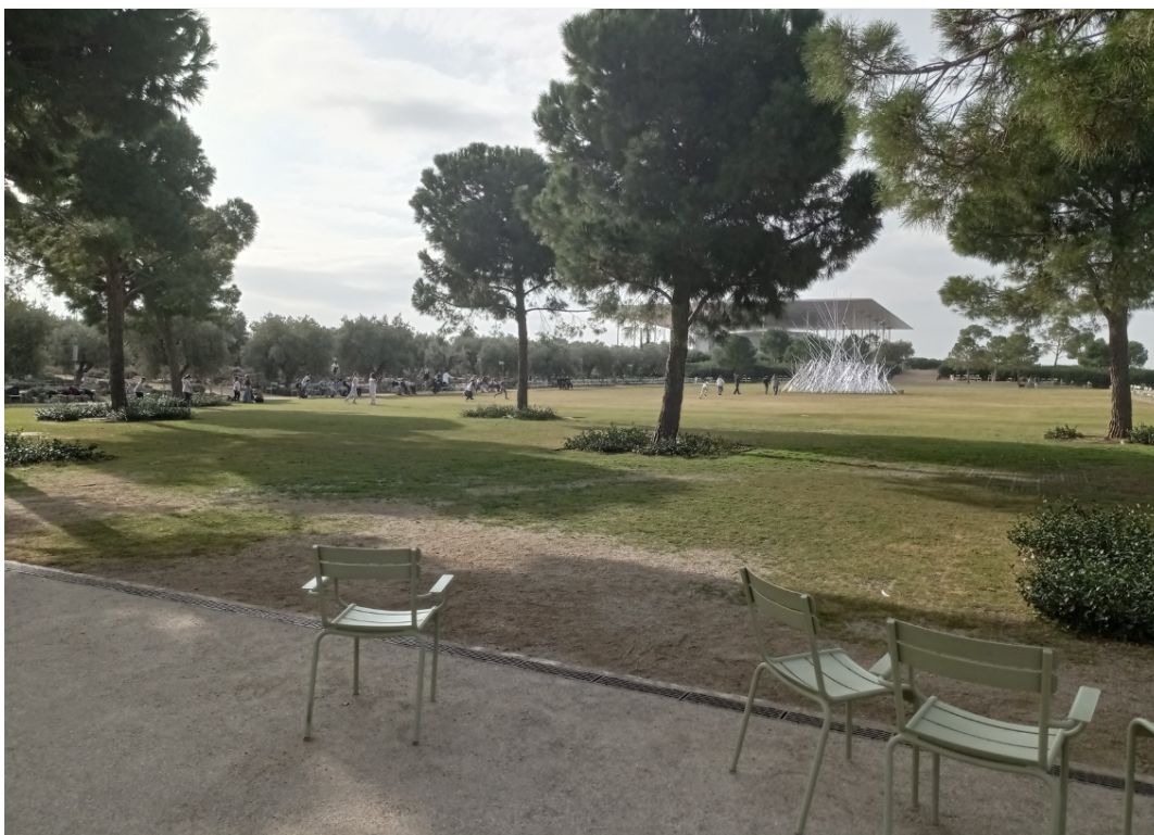
Stavros Niarchos Kultur Zentroa Atenasen, Grezian

Kontrako adibidea gune libreak, familia bakarreko eraikinak eta berdeguneak nagusi diren aldirietako eremuak dira. Hor, ingurumen-parametroen kalitatea ona da, eta errenta-maila handia.