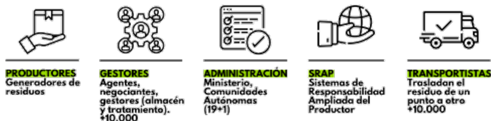
2. irudia. 7/2022 Legeak eragindako sektoreak.

Hala, KESEL erabat hedatzeko beharrezkoa izango den zeharkaldi luzearen barruan lehen urteurrena betetzearekin batera, ziurgabetasun berriak sortu dira eragindako sektoreetan, eta ez dira gutxi. Egia esan, inor ez da erantzukizunetik salbuetsita geratzen; izan ere, guztiok gara, neurri handiagoan edo txikiagoan, hondakinen ekoizleak, eta gure zeregina bete behar dugu.