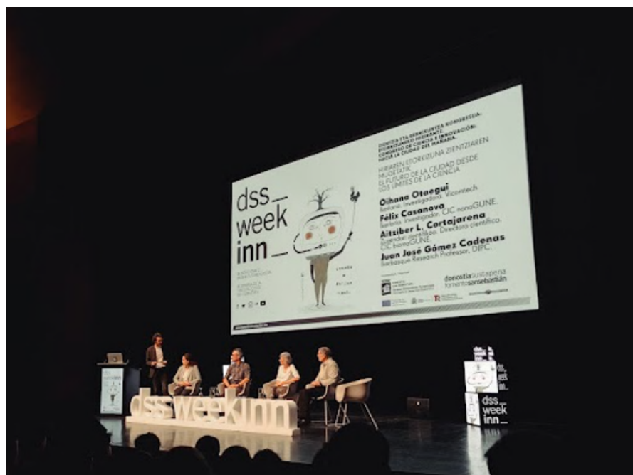
Kongresua "Zientzia eta Berrikuntza: biharko hiria" ireki zuen Donostiako WeekINN ren IX.

Inpaktua sortzen duten aukerak eta proiektuak bilatzeko kultura dugu, María Cristina hotelak izan zuen eta oraindik egiten duen bezala, oraindik Sustapenaren jabetzakoa dena eta hiriaren garapenean zeresan erabakigarria izan duela uste dut. . Hala ere, kontziente izan behar dugu eragin-maila hori lortzea konplexua dela. Garaiak bizi ditugu, urteak dira, non konplexutasuna modu esponenzialean ugartu den, eta balioa sortzea, garrantzitsua izatea, osagai asko behar dituen da, baina batez ere, elkarlanaren osagaia.