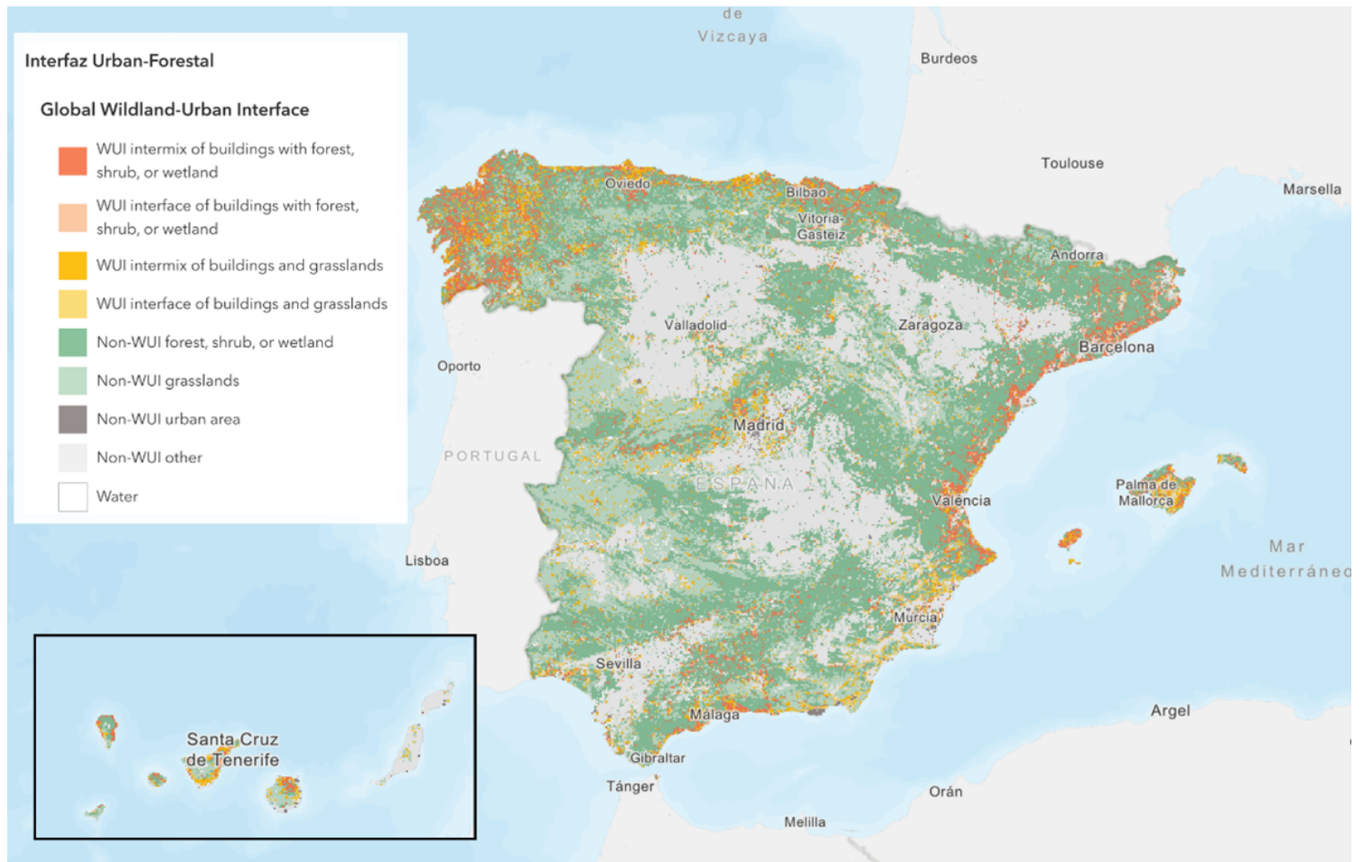
Figura 2. Distribución de la Interfaz Urbano Forestal en España. ArcGIS Online – Esri España (Living Atlas), mapa “Interfaz Global Urbano-Forestal (WUI)”.

Un estudio realizado en la Comunidad Autónoma de Valencia analizó 4.889 incendios forestales (2010–2023) y demuestra que el 36,1 % de las igniciones ocurrieron dentro de la IUF, pese a que esta solo ocupa aproximadamente el 15 % del territorio.