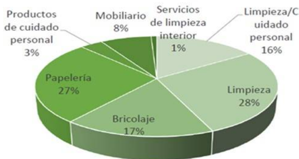
Figura 2. Distribución porcentual de los tipos de productos que disponen de eco-etiquetado europeo en Euskadi.

Esta eco-etiqueta aparece asociada a una gran variedad de productos. Entre los productos vascos son más relevantes los artículos de limpieza, muebles, bricolaje y papelería. También certifica al sector servicios, aunque su uso está menos extendido. Las empresas del sector servicios tienden a certificar toda la entidad mediante sistemas de gestión ambiental.