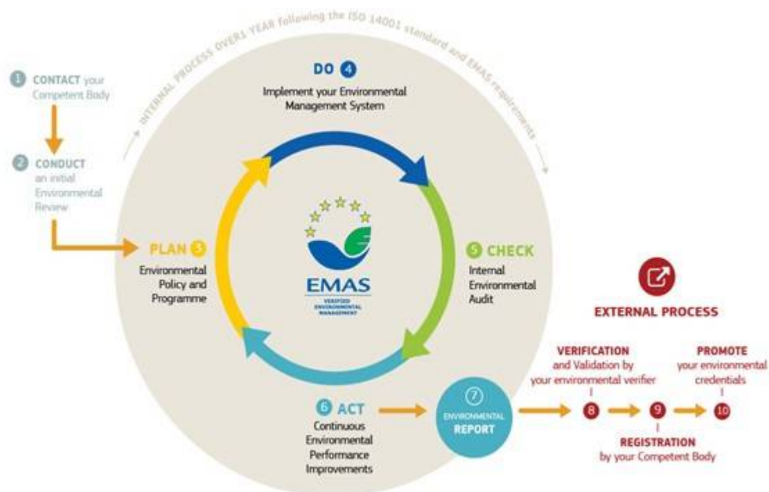
Figura 5. Procedimiento a seguir dentro de la empresa basado en la evaluación interna continuada.

En Euskadi son 120 centros y 29 entidades públicos los que cuentan con este sistema de gestión ambiental, así como otro 68 centros privados y 55 entidades. Anualmente el Gobierno Vasco subvenciona la verificación y las sucesivas renovaciones des Sistemas de Gestión Ambiental EMAS. Optar a este distintivo, más allá de la mejora ambiental, permite reposicionar a la empresa ante sus clientes, ambas tareas ineludibles en estos tiempos.