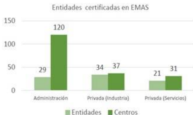
Figura 4. entidades y centros vascos que cuentan con EMAS, datos actualizados para febrero del 2020.

cíclica, esto permite una evolución progresiva para corregir prácticas menos favorables para el medio ambiente.