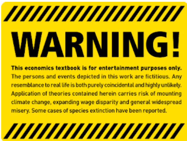
Imagen de la campaña Kick it over de Adbusters

Siguiendo con Latouche: paseando el otro día por una librería me encontré con el libro " Pequeño tratado del decrecimiento sereno ", de Serge Latouche ( Icaria editorial, s. a. ), el cual casi me vi obligado a comprar... Y así lo hice. Poco más del prólogo he avanzado, pero ya me ha llamado la atención las 8 "R"; sinceramente, yo sólo conocía las famosas 3 "R": Reducir, Reutilizar, Reciclar, y ahora Latouche añade unas cuantas más. Estas son las 8 "R": Revaluar, Reconceptualizar, Reestructurar, Redistribuir, Relocalizar, Reducir, Reutilizar, Reciclar