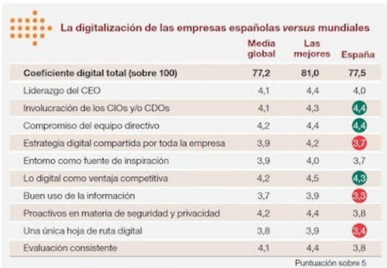
gráfico de imasideas.com

Para realizar la valoración la consultora ha tenido en cuenta desde el liderazgo de los CEO pasando por el el compromiso adquirido para la digitalización del equipo directivo como la hoja de ruta digital de la empresa.