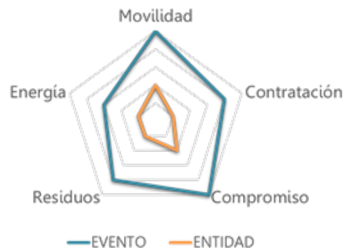
Nivel de impacto relativo por ámbito

Con el fin de asegurar la calidad de los resultados, desde Naidier pusimos especial atención en la recogida de los datos necesarios. Para ello se utilizaron encuestas, entrevistas y jornadas de trabajo con la dirección, plantilla, y proveedores de bienes y servicios.